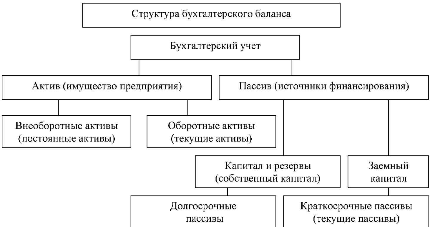
Рисунок 4. Структура бухгалтерского баланса

Для понимания содержащейся в нем информации важно иметь представление не только о структуре бухгалтерского баланса (рисунок 4), но и знать основные логические и специфические взаимосвязи между отдельными показателями, а также осуществлять их оценку с учетом способов и методов, которые применялись при формировании бухгалтерской информации в соответствии с принятой учетной политикой. [21]